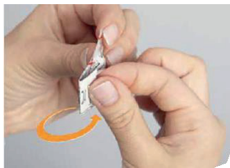
Einzelnen Blister an der markierten Linie knicken

Die Patienten sollten angewiesen werden, NICHT zu versuchen, die Tabletten aus der Blisterpackung zu drücken , da dies die Buccaltablette beschädigen könnte.