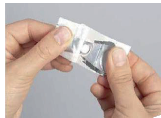
Folie des Sicherheitsblisters abziehen